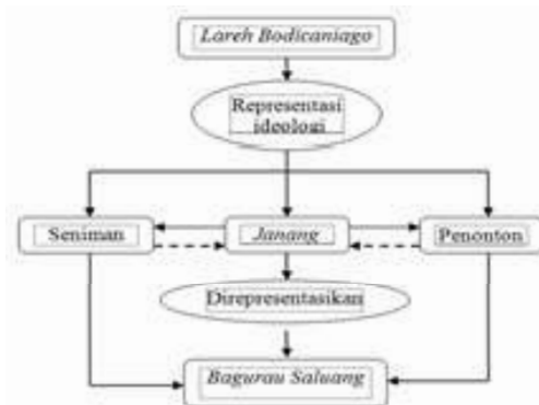
Bagan 1. Representasi ideologi bagurau dalam pertunjukan saluang

Adanya konflik tersebut karena adanya perbedaan nilai yang membentuk tingkah laku dan pengetahuan masyarakat pencinta seni pertunjukan. Konflik yang dimaksud dalam bagurau pada pertunjukan saluang-dendang , bukanlah konflik fisik, akan tetapi lebih menonjol kepada konflik psikologis atau pemikiran melalui perdebatan yang dikemas melalui ungkapan sastra berbentuk pantun yang didendangkan dialektis. Paradigma ideologis yang direpresentasikan dalam bagurau dalam pertunjukan saluang-dendang dapat dilihat pada bagan berikut.