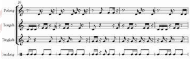
Notasi 3. Mudiak Arau (Transkripsi Nadya Fulzi 2011)

Notasi dendang Mudiak Arau di atas dihasilkan melalui teknik hocketing melalui tiga orang pemain talempong yang masing-masing disebut polong (2 dan 4), tongah (1 dan 3), dan tingkah (5 dan 6). Ketiganya memukul membunyikan – talempong pada posisinya masing-masing sejalan dengan perjalanan melodi dendang. Semenara itu, talempong renjeang Jantan, Paningkah, dan Pangawinan – juga dimainkan oleh tiga pemain talempong dengan teknik interlocking . Talempong basaua dengan teknik hocketing dapat dikatakan representasi dari Lareh Nan Bunta . Talempong basaua dengan teknik hocketing hanya ada di Luhak 50 Koto Minangkabau. Sementara itu, permainan ritme gandang (gendang) pada talempong basaua merupakan bagian dari komposisi musiknya, terutama berfungsi sebagai pemberi aksentuasi ritme dan pengiring dalam melengkapi melodi lagu. Namun gandang tidak memiliki fungsi sebagai penentu tempo permainan, karena kendali tempo permainan sepenuhnya dipegang oleh pemain talempong.