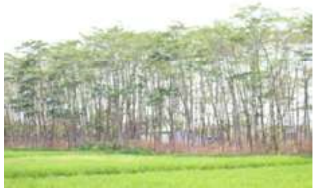
Gambar 7. Pohon albasiyah yang dibudidayakan (Dokumentasi foto Kusnanta RG, 2015).

dibudidayakan penanamannya secara besar, sedangkan kayu waru , pulé , jaranan , dhondhong jaran tidak dibudidayakan penanamannya. Dengan demikian dimungkinkan kayu bahan utama pembuatan wayang golek akan semakin langka. Kiranya tidak berlebihan apabila perlu memikirkan dan melakukan tindakan untuk ikut menjaga lingkungan agar pohon tumbuh tidak begitu mudahnya ditebang untuk membuat boneka wayang golek tanpa diikuti dengan penanaman pohon baru. Dengan demikian, perlu mengambil tindakan pembuatan boneka wayang golek yang menghasilkan boneka wayang lebih besar, ringan, dan ramah lingkungan.