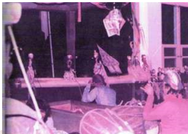
Gambar 3. Pertunjukan wayang golek dilihat dari belakang dalang (Foto koleksi Trisno Santoso, 1982).