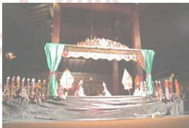
Gambar 4. Pertunjukan wayang golek dilihat dari depan dalang.

Bahan utama pembuatan wayang golek adalah kayu terpilih yang mempunyai beberapa keunggulan tertentu utamanya berberat jenis ringan, ulet, dan lunak ( empuk ). Bahan utama pembuatan kepala wayang golek di masing-masing daerah mempunyai pilihan kayu tersendiri yang umumnya terdapat di daerah tersebut. Di Yogyakarta bahan utama pembuatan kepala wayang golek menggunakan kayu Pulé , Waru , dan Ibasiyah , di Kebumen menggunakan kayu jaranan , dan albasiyah , di Tegal, Batang, serta Pekalongan menggunakan kayu dhondhong jaran . Adapun bahan utama pembuatan badan boneka wayang golek di Kebumen dan Yogyakarta menggunakan kayu bunga kenanga. Bahan kayu bunga kenanga dipilih karena berat jenisnya lebih kecil apabila dibandingkan dengan kayu jaranan , pulé , serta waru dengan demikian diharapkan boneka wayang akan lebih ringan. Khusus kayu albasiyah