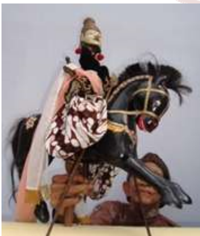
Gambar 2. Boneka wayang kuda dengan bahan utama kayu.

Paparan tersebut menunjukkan bahwa Wayang Golek menggunakan busana seperti layaknya manusia dengan gaya Arab, akan tetapi semua boneka menggunakan kain batik layaknya memakai sarung. Hal ini menunjukkan bahwa busana dan cerita Wayang Golek perpaduan antara Arab dan Jawa. Pertunjukan Wayang Golek Ménak Yogyakarta sering menampilkan boneka wayang hewan seperti kuda, gajah, ular, harimau, babi hutan, wahbru, dan lain-lain. Untuk membuat boneka wayang hewan bahan utama yang digunakan kulit lembu, atau kulit kerbau. Adapun khusus untuk boneka wayang kuda menggunakan bahan utama kayu. Di samping itu pertunjukan Wayang Golek Ménak Yogyakarta juga menggunakan kayon dengan bahan utama kulit seperti pada pertunjukan Wayang Kulit Purwa (Soetarno, 1990:32).