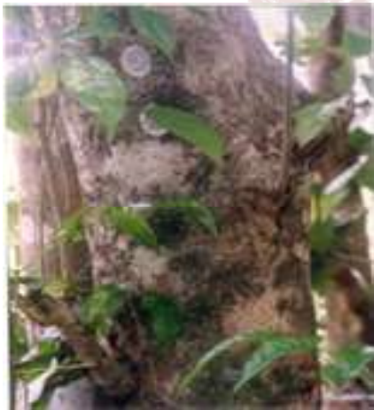
Gambar 5. Pohon jaranan yang mulai langka (Dokumentasi foto Dewanto Sukistono, 2013).