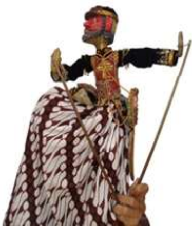
Gambar 1. Tokoh Umarmaya Wayang Golek Ménak Yogyakarta dengan bahan utama kayu (Dokumentasi foto koleksi; Trisno Santoso, 2016).

Paparan tersebut menunjukkan bahwa Wayang Golek menggunakan busana seperti layaknya manusia dengan gaya Arab, akan tetapi semua boneka menggunakan kain batik layaknya memakai sarung. Hal ini menunjukkan bahwa busana dan cerita Wayang Golek perpaduan antara Arab dan Jawa. Pertunjukan Wayang Golek Ménak Yogyakarta sering menampilkan boneka wayang hewan seperti kuda, gajah, ular, harimau, babi hutan, wahbru, dan lain-lain. Untuk membuat boneka wayang hewan bahan utama yang digunakan kulit lembu, atau kulit kerbau. Adapun khusus untuk boneka wayang kuda menggunakan bahan utama kayu. Di samping itu pertunjukan Wayang Golek Ménak Yogyakarta juga menggunakan kayon dengan bahan utama kulit seperti pada pertunjukan Wayang Kulit Purwa (Soetarno, 1990:32).