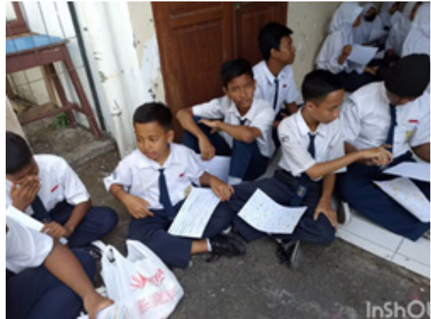
Gambar 5. Pemberian materi praktek cara menciptakan karya seni kaligrafi arab teknik cetak tinggi.