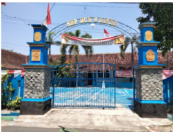
Gambar 3. SMP Muhammadiyah 9 Jaten, Karanganyar.

1. Tahap mengidentifikasi suatu permasalahan di lokasi workshop yaitu di SMP Muhammadiyah 9 Jaten, Karanganyar. Dalam mengidentifikasi permasalahan tersebut tim pengabdian mendatangi langsung lokasi yang akan dijadikan workshop yaitu di SMP Muhammadiyah 9 Jaten, Karanganyar. Hasil dari kunjungan tersebut disimpulkan bahwa yang menjadi kendala adalah bukan masalah teknik tetapi juga publikasi hasil workshop .