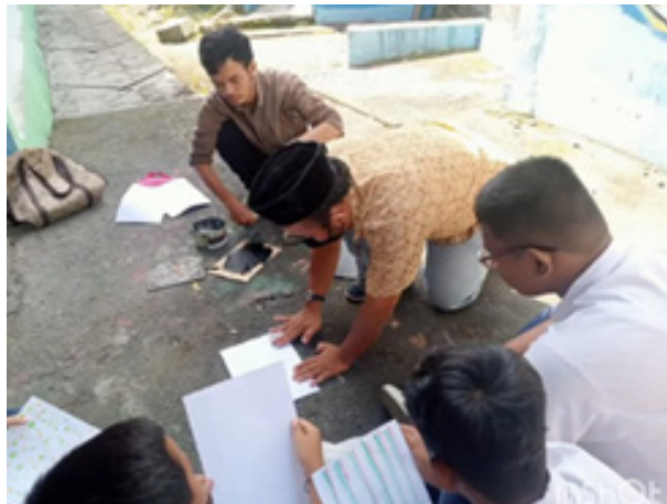
Gambar 5. Pemberian materi praktek cara menciptakan karya seni kaligrafi arab teknik cetak tinggi.