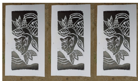
Gambar 2. Contoh Karya Cetak Tinggi dengan Media Kertas.

Seni cetak tinggi merupakan salah satu cabang dari teknik seni grafis yang sudah populer di masyarakat, berkembang semenjak jaman belanda sebagai media duplikasi arsip, gambar atau lainnya. Pada tahun 1946 dalam rangka hari ulang tahun kemerdekaan republik Indonesia yang pertama, dua seniman Indonesia yaitu Mochtar Apin dan Burhanudin Marasutan berkarya teknik linocut dan mengirimkannya ke negara-negara yang notabene negara sahabat Indonesia. Linocut yang masuk di dalam rumpun teknik seni cetak tinggi seni grafis menjadi media berekspresi seperti halnya seni lukis atau seni lainnya (Adi et al., 2020), (Adi, 2018), (Adi, 2020).