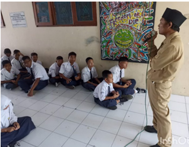
Gambar 4. Pemberian materi secara teori mengenai workshop seni kaligrafi cetak tinggi dan publikasi via YouTube.