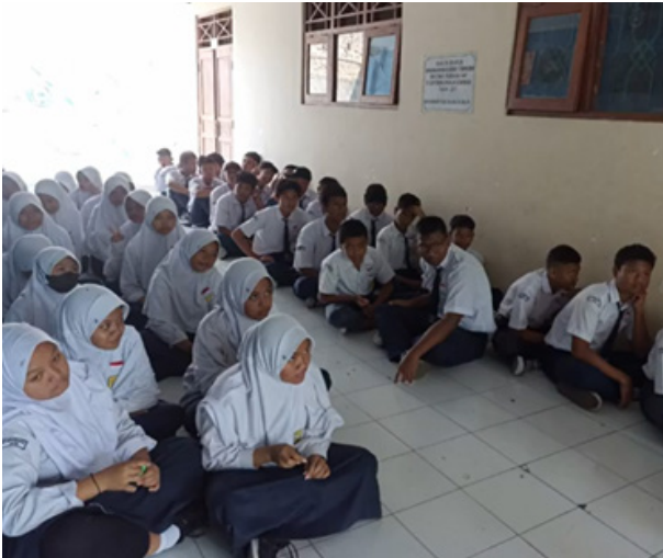
Gambar 3. Pemberian materi secara teori mengenai workshop seni kaligrafi cetak tinggi dan publikasi via YouTube.