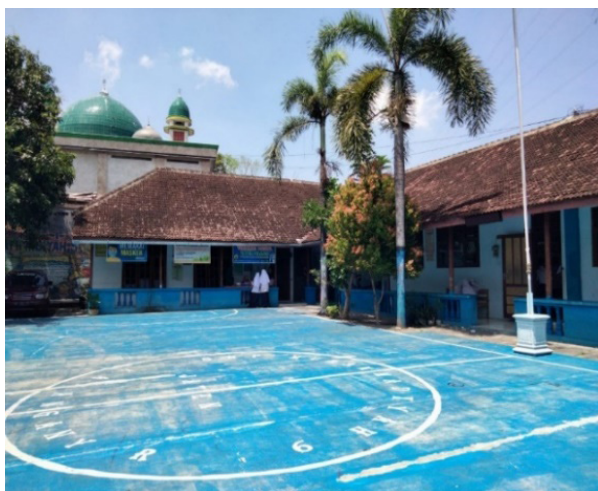
Gambar 1. Lokasi Workshop Seni Kaligrafi Cetak Tinggi.

Rencana pemecahan masalahnya yaitu membuat aplikasi dan pemahaman mengenai pentingnya menggunakan YouTube sebagai sarana publikasi dalam bidang workshop , khususnya workshop seni kaligrafi dengan teknik cetak tinggi.