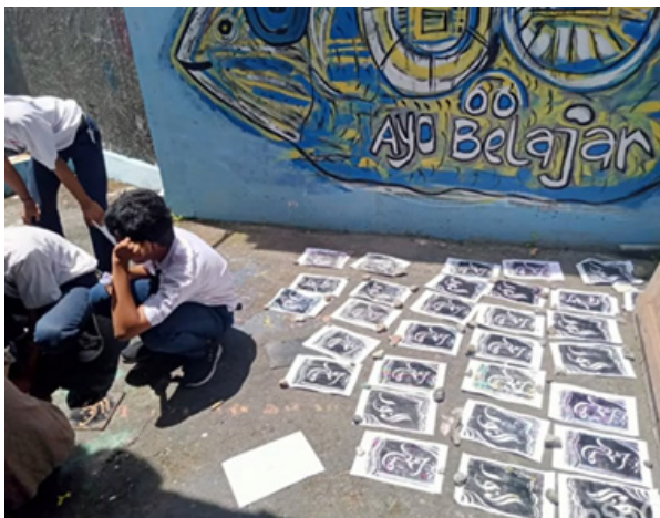
Gambar 7. Evaluasi Karya.

3. Tahap mengevaluasi para peserta dan juga hasil karya. Pada tahap ini karya-karya mulai dievaluasi dan kemudian didokumentasikan. Kumpulan Sumber dan video singkat tersebut diedit menjadi video dokumentasi workshop . Editing menggunakan HP atau dengan laptop dan komputer dengan software editing video Inshot. Untuk kemudian diupload di kanal YouTube makmoer art project.