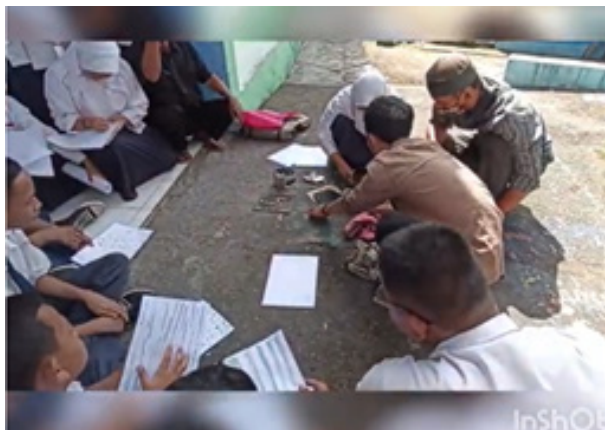
Gambar 6. Pemberian materi praktek cara menciptakan karya seni kaligrafi arab teknik cetak tinggi.