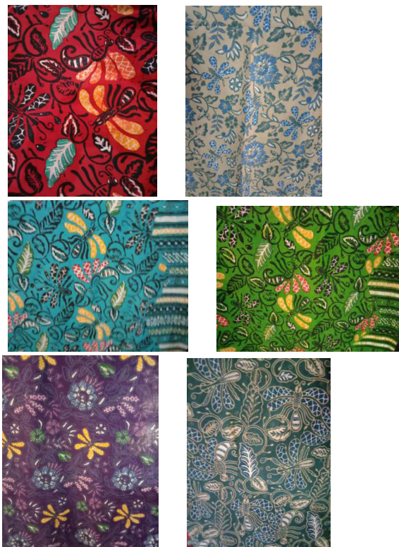
Gambar 7. Perubahan dan Perkembangan Batik Motif Walang (Daru Colection)

Penggunaan motif batik walang pada ASN dan pegawai di lingkungan pemda Gunungkidul dapat dilihat dari beberapa contoh motif batik walang, di bawah ini: