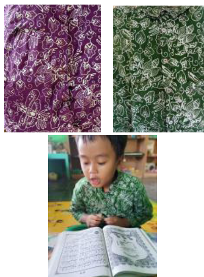
Gambar 3. Motif Batik Walang Pelajar Warna Ungu untuk PAUD dan Warna Hijau untuk TK/MI

Perkembangan batik motif walang juga mengalami perubahan dan perkembangan sesuai dengan selera masyarakat sebagai konsumennya. Berikut beberapa perkembangan dan perubahan batik motif walang untuk seragam sekolah dan ASN di Gunungkidul: