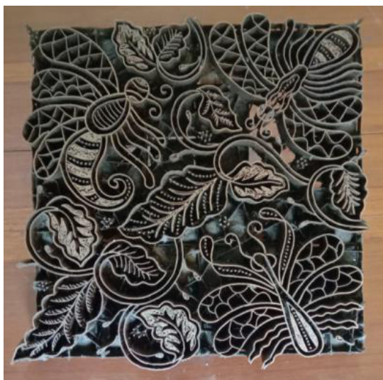
Gambar 6. Motif Batik Walang Sinanding Jati (Cap Batik)

Selain batik untuk seragam siswa-siswi pelajar, juga terdapat batik walang lain yang digunakan untuk seragam ASN atau pegawai di lingkungan Kabupaten Gunungkidul. Batik motif walang yang dibuat lebih memiliki variasi warna, padahal untuk warna yang harus digunakan adalah warna coklat. Juga terdapat beberapa penambahan motif untuk memperindah tampilan batik walang khas Gunungkidul.