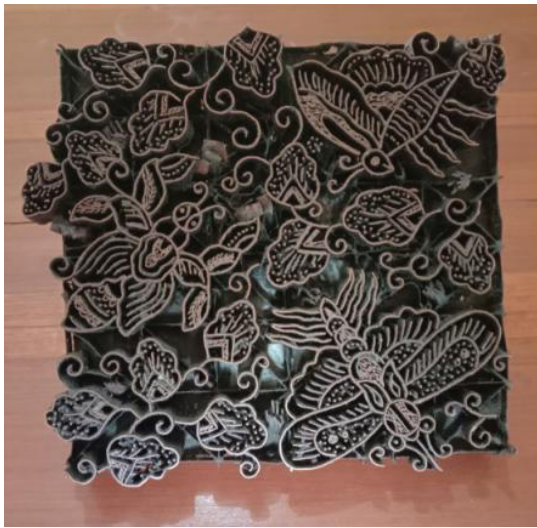
Gambar 5. Motif Batik Walang Jati Kencono (Cap Batik)

proses produksi yang singkat dengan proses pewarnaan satu kali celup.