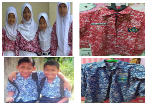
Gambar 4. Motif Batik Walang Pelajar Warna Merah untuk SD dan Warna Biru untuk SMP

ASPETIG membenarkan bahwa motif batik Walang Jati Kencono yang digunakan untuk seragam pelajar Gunungkidul sedikit mengalami perubahan terutama untuk ukuran. Ukuran ini disesuaikan agar motif dapat ditata rapi dan dapat diaplikasikan teknik batik cap. Tujuan digunakannya batik cap adalah menekan harga jual produk dan percepatan