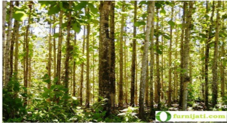
Gambar 2. Walang dan daun jati