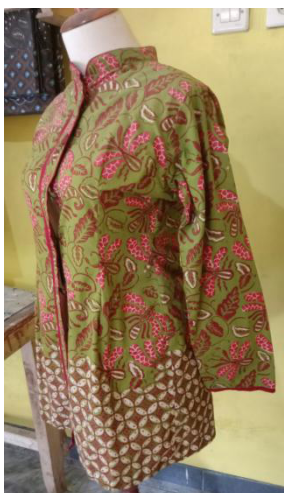
Gambar 8. Perubahan dan Perkembangan Batik Motif Walang untuk seragam pegawai/ASN di Kabupaten Gunungkidul dengan kombinasi Batik Kawung (Kalimosodo Colection)