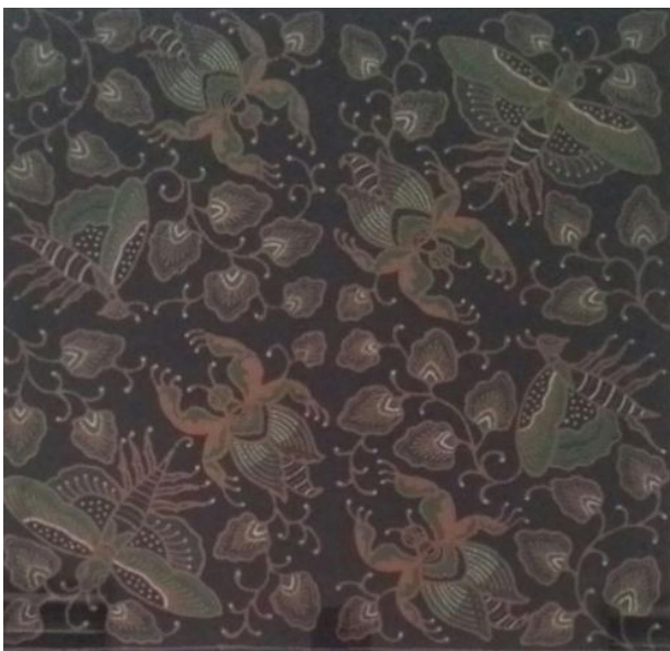
Gambar 1. Desain Motif Batik Walang Jati Kencono yang ditetapkan untuk seragam khusus pelajar PAUD, SD/MI, SMP dan SMA/SMK di wilayah Kabupaten Gunungkidul

skill para pembatik di Gunungkidul dalam mempersiapkan Sumber Daya Manusia para pelaku pembatik atau produsen yang mampu memenuhi standar mutu, baik secara kualitas dan kuantitasnya.